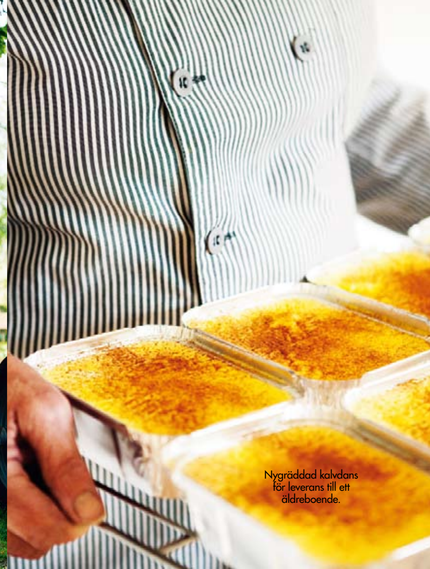
Nyräddad kalvdans för leverans till ett äldreboende.