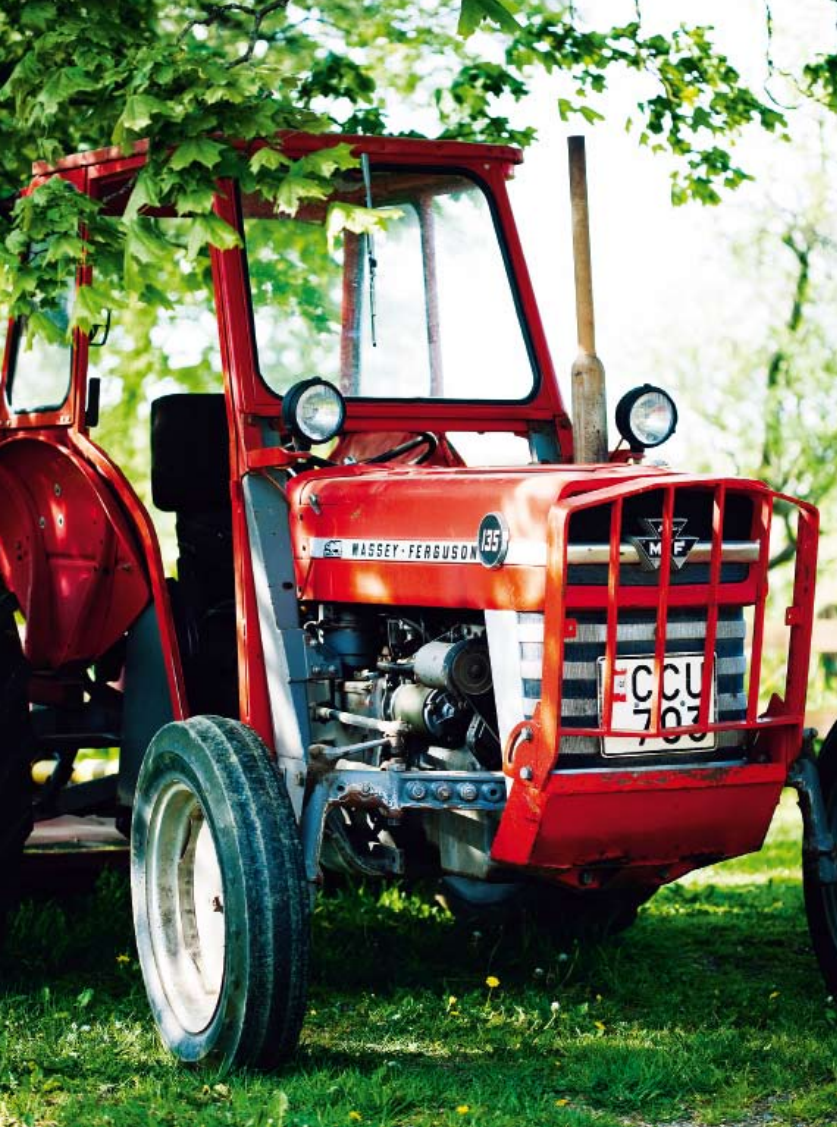
På ett år hinner ungefär 60 000 portioner kalvdans lämna gården i Eggvena, strax utanför Herrljunga.